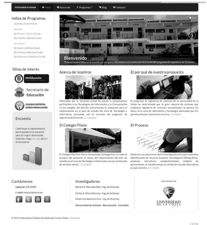
Figura N°3. Página principal del sitio