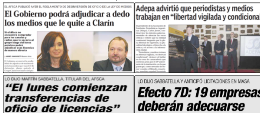
Imagen 2. Encuadre ‘Polarización político-económica’ en la cobertura del “7D” en Ámbito Financiero y El Cronista Comercial .

Fuente: El Cronista Comercial , 14 y 5 de diciembre de 2012. Ámbito Financiero , 15 de noviembre y 4 de diciembre de 2012.