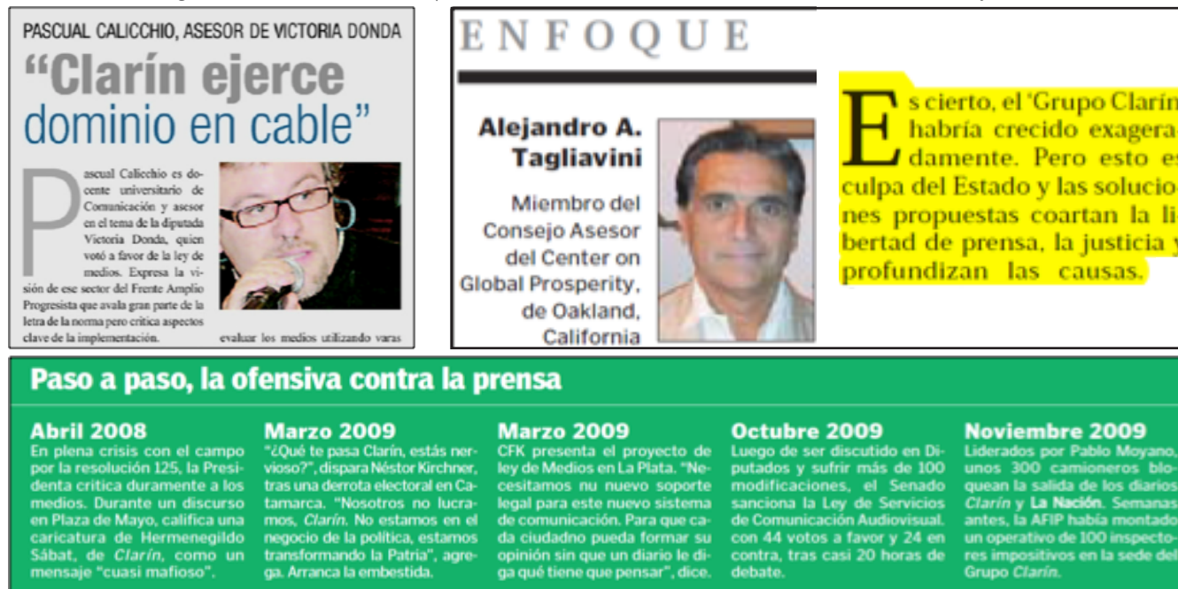
Imagen 3. Riesgos del Encuadre 'Polarización político-económica' en la cobertura del "7D" en Ámbito Financiero y El Cronista Comercial .