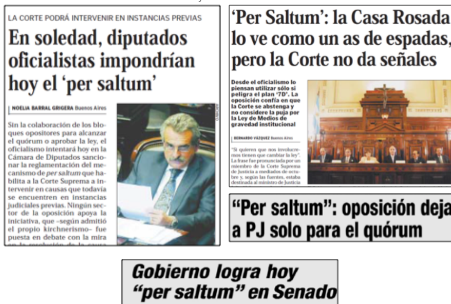
Imagen 1. Encuadre 'Disputa político-institucional' en la cobertura del "7D" en Ámbito Financiero y El Cronista Comercial .