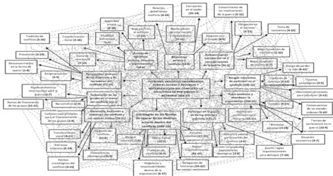
Figura 2. Red semántica “Patrones violentos organizados para el acceso a recursos y naturalización del conflicto: la disyuntiva de pertenecer o retirarse”

Además de ello, se encuentran las vivencias personales y la forma de actuar de los sujetos entrevistados para de cierta forma sobrevivir (Espinosa, 2018; Torres et al., 2017; Rosero, 2004; Banquez, 2022). Respecto de este asunto en particular, se destacan los siguientes discursos: “un solo mes, de tres años me dieron un mes, eso iba a ser un 24 de diciembre, cuando eso solo pase 24 y 31, a los dos días me llegó una llamada al teléfono que decía: Camarada Maicol necesitamos que se recoja” (P3- F) y “el castigo más duro era que si lo mandaban a uno a buscar el mercado y uno renegaba o si decía que no, lo castigaban, le echaban dulce en los pies, lo empetolaban y lo amarraban a uno, y ya ahí las hormigas lo comenzaban a clavar y el dolor, a veces, lo enterraban por ahí hasta la mitad del cuello y le ponían a uno un horario para que se saliera; una cuchara en la boca y si usted no tenía ese horario lo mataban” (P5-G).