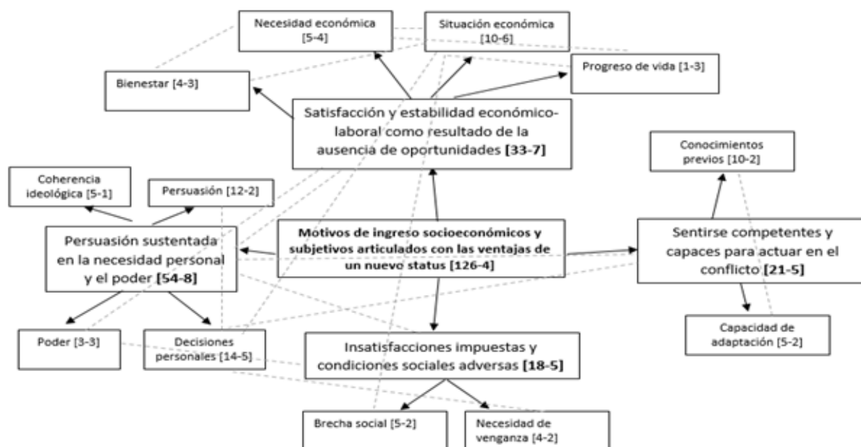
Figura 1. Red semántica “Motivos de ingreso socioeconómicos y subjetivos articulados en las ventajas de un nuevo status

Los códigos más recurrentes en esta red semántica son “persuasión sustentada en la necesidad personal y el poder” y “satisfacción económico-laboral como resultado de la ausencia de oportunidades”. Para los participantes los motivos de ingreso varían según las experiencias y se evidencian razones económicas, necesidad de venganza y coherencia ideológica, entendiendo por esta última las estrategias que implementan los grupos armados para generar sublevación en los sujetos (Gurr, 1970; Ballentine y Sherman, 2003; Collier, 2000; Bates, 2008; Collier y Hoeffler 19978 y 2004). Al respecto, uno de los participantes señaló: “eso es otra cosa que iba a decir cuando la gente entra por una idea, una venganza o por una situación económica, en este momento no se la puedo decir, yo puedo estar mal” (P1-C).