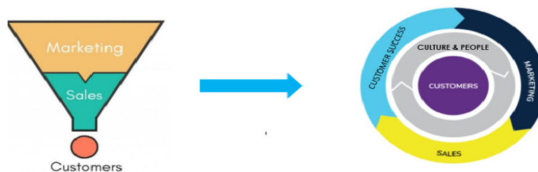
Figura 3. Modelo de captura de cliente