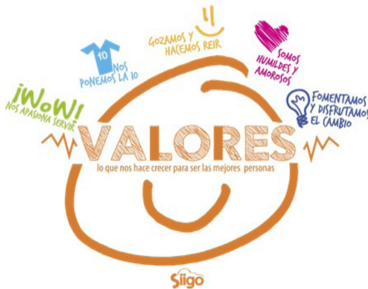
Figura 1. Valores de Siigo