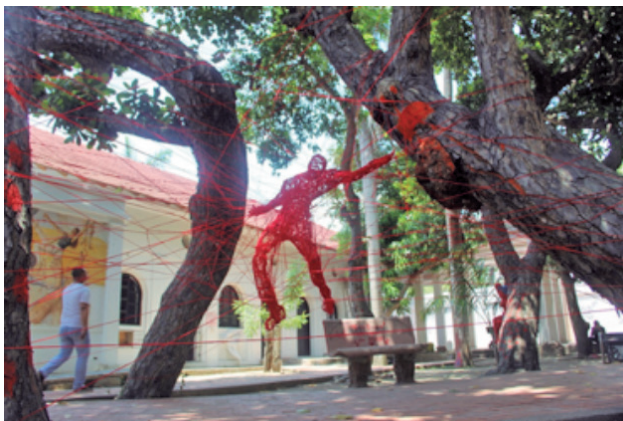
Víctor Rodelo Caraballo. Tu parte de mí , 2013. Cuerda roja. Instalación in situ.