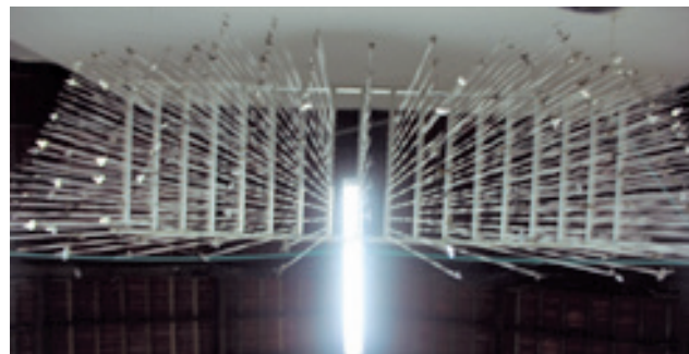
Yira Padrón Jiménez. ¿Qué hay después de los sueños? , 2013. Instalación in situ (1.001 llaves). Dimensiones variables.