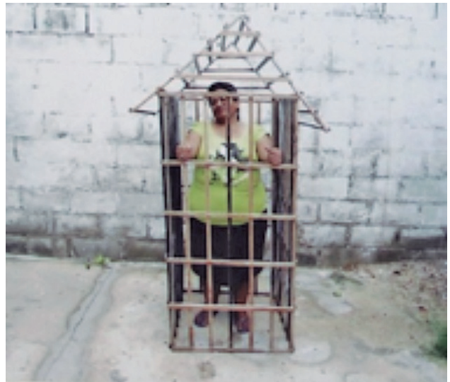
Ángel Vesga Flórez. Mentes confinadas , 2013. Arte procesual, Fotografía. 100 x 200 cm.